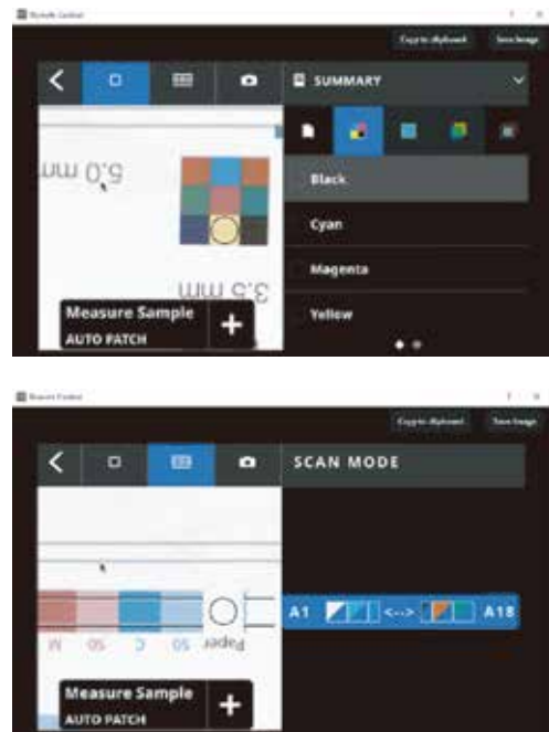
图2： 这些图片显示了单点（上）和扫描（下）模式下对精确测量点的视频预览。