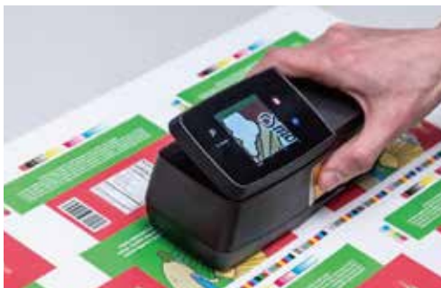
图1： Mantis视频目标定位对于在繁忙的色彩工作中捕获小面积区域非常实用。

Mantis同时适用于专色和扫描模式。凭借可以进行内部模式识别的综合扫描功能，它在单次扫描下即可读取一系列色块，从而显著提高色块测量的速度。