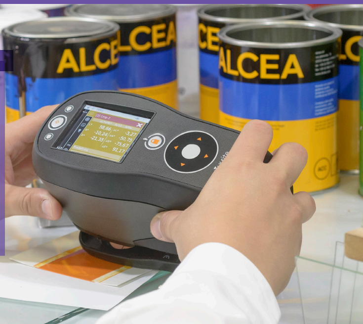
▲ 图为: Ci60 在实验室中测量样品